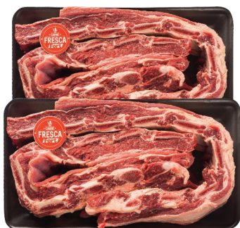
Costela Bovina Minga ou Ripa Carne Fresca Bdj. kg