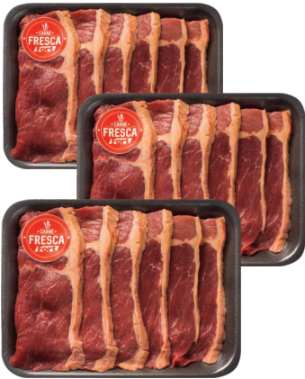
Coxão Duro Carne Fresca Bdj. kg