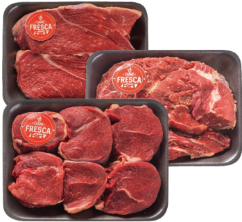
Acém ou Paleta Bovina S/ Osso Carne Fresca Bdj. kg

CHEGOU AÇOUGUE COM CARNE FRESCA TODO DIA!