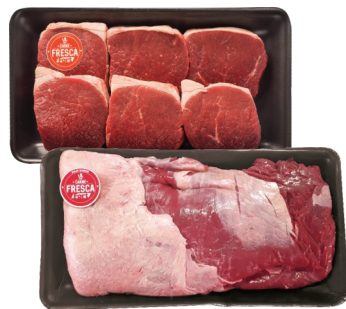
Capa de Contra Filé ou Lagarto Bovino Carne Fresca Bdj. kg