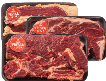
Acém, Paleta ou Ponta de Peito Bovino c/ Osso Carne Fresca Bdj. kg