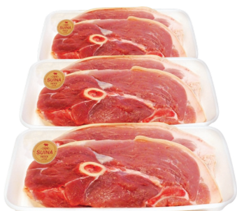
Paleta ou Pernil Suíno c/ Osso Carne Fresca Bdj. kg