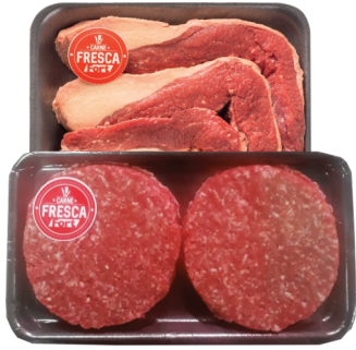
Ponta de Peito ou Hambúrguer Bovino Carne Fresca Bdj. kg