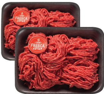
Carne Moída Acém ou Paleta Bovina Carne Fresca Bdj. kg