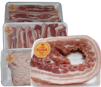
Costelinha ou Panceta Suína c/ Osso Carne Fresca Bdj. kg