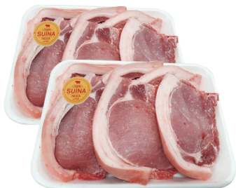
Bisteca Suína c/ Toucinho Bandeja kg