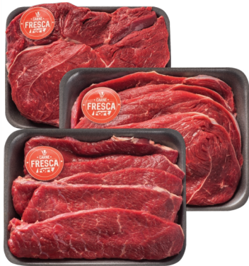
Coxão Mole ou Patinho Bovino Carne Fresca Bdj kg