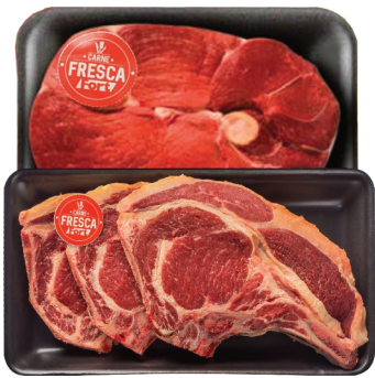
Filé Americano ou Bisteca Bovina Carne Fresca Bdj. kg