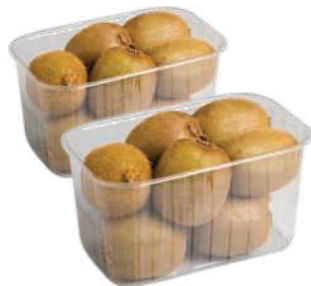
Kiwi Bandeja 600g