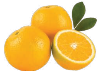
Laranja Lima kg