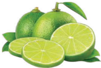
Limão Tahiti kg