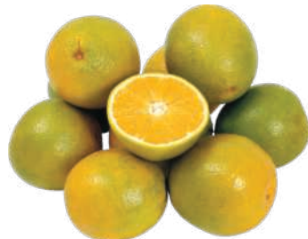
Laranja Pera kg