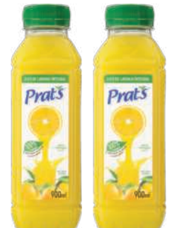
Suco Prats Integral Laranja 900ml