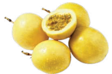
Maracujá Azedo kg