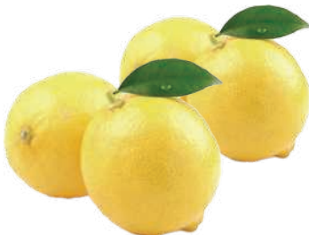
Laranja Lima Persia kg