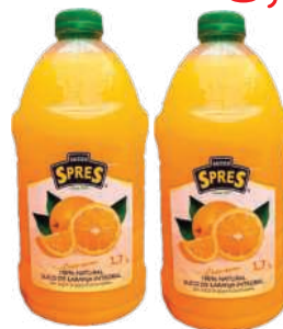
Suco integral de Laranja Spres 1,7 Litro