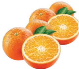
Laranja Bahia kg